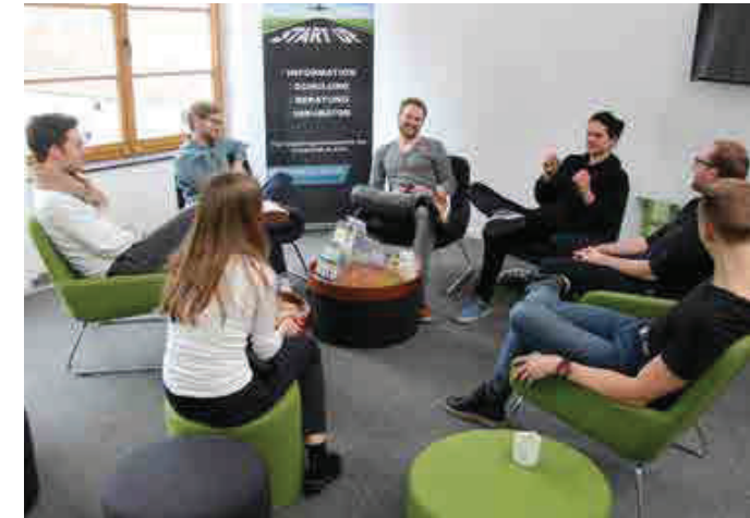
Digitale Start-ups fördern und Wissen in die Gesellschaft tragen – das sind die Ziele der Kölner Universitätsstiftung.