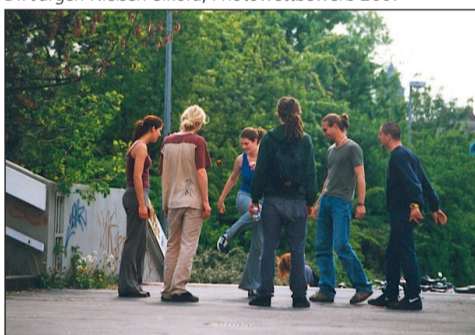
FotoTeamBio, Photowettbewerb 1999